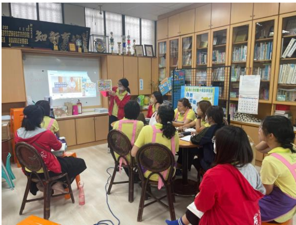
抽問老師校外人士侵入校園處理流程4字訣 「保-報-換-輔」照片