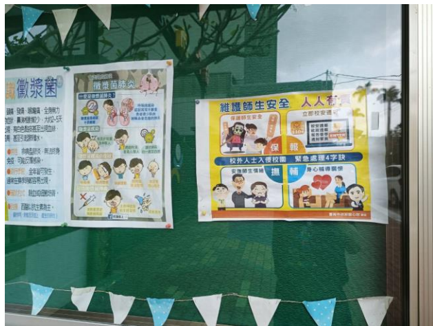
張貼校外人士侵入校園處理流程Q版圖卡