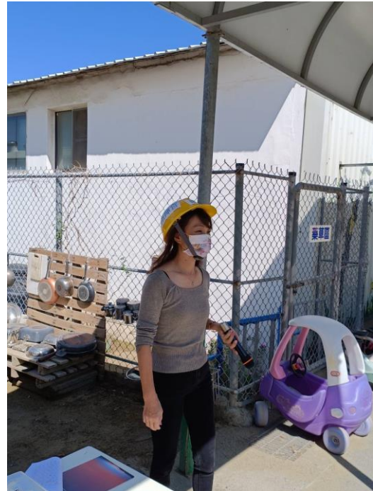
啟動學校緊急應變組織